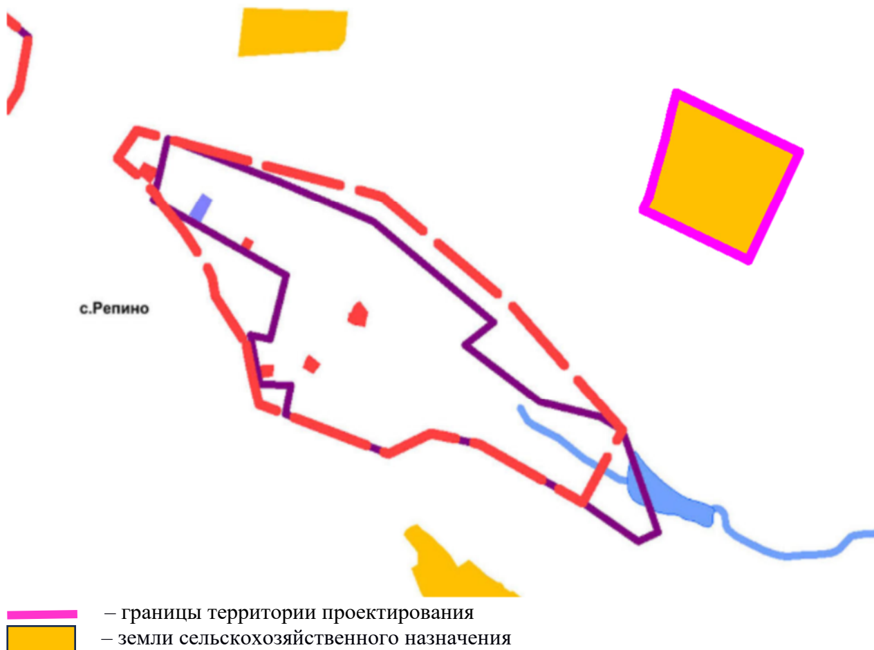
Рис. 2. Фрагмент карты границ населенных пунктов входящих в состав сельского поселения действующего Генерального плана муниципального образования Ароматненское сельское поселение Бахчисарайского муниципального района Республики Крым

Проект межевания территории разработан на основе кадастрового плана территории.