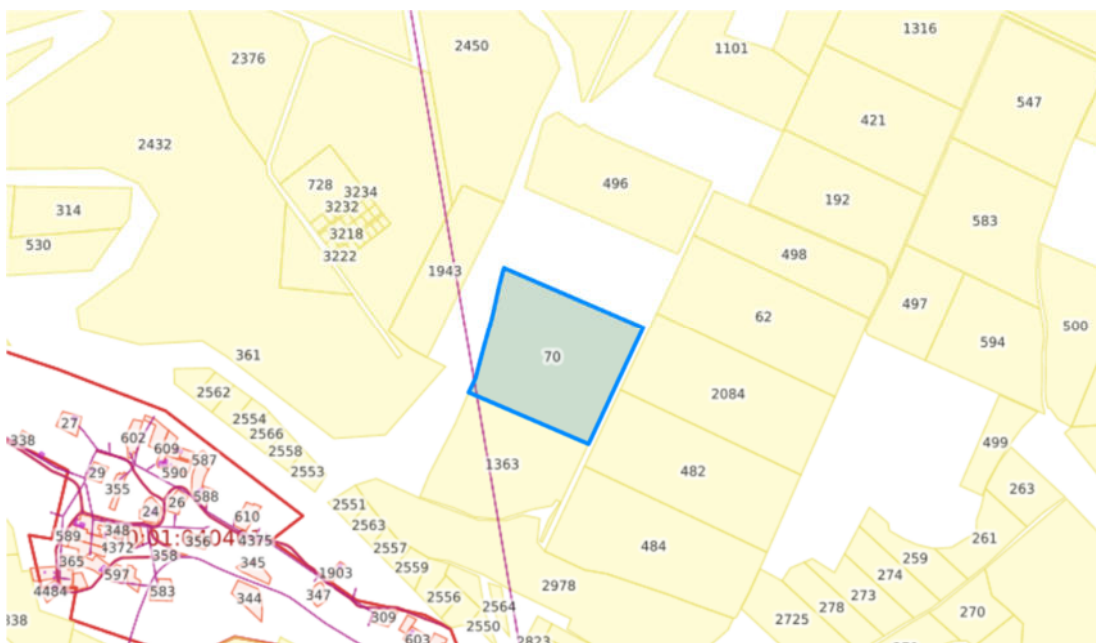
Рис. 1. Схема расположения участка проектирования на публичной кадастровой карте

Местоположение участка проектирования представлено на рисунке 1.